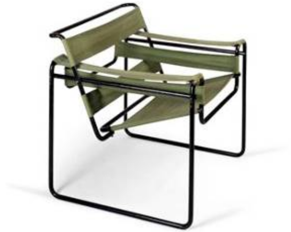
Marcel Breuer, fauteuil B3 'Wassily', 1927/28