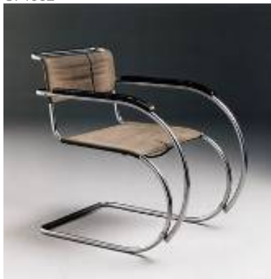
Mies van der Rohe, Fauteuil 'Weissenhof' 1932