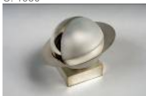
Lampe Métal argenté, verre dépoli. C. 1930.