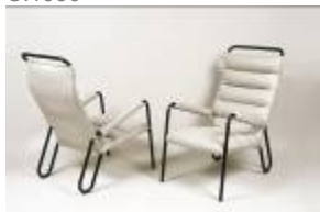
Jean Burkhalter, 3 fauteuils en tube métallique. C. 1930