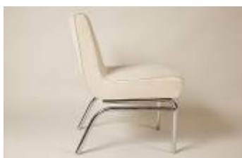
Adrienne Gorska, Paire de chauffeuses, Créées pour l'atelier de Tamara de Lempicka. C. 1935