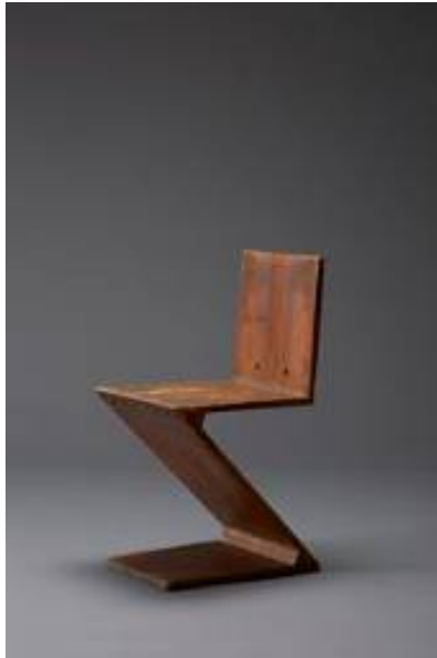
Gerrit Rietveld, Chaise Zig Zag, C. 1932