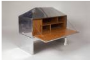
Sarah Lipska, Coffre en aluminium et merisier C. 1925