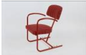
Fauteuil à inclinaison variable, métal tubulaire peint en rouge. C. 1935