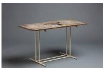
Eileen Gray, Table en pin d'Oregon, Piètement tubulaire en acier peint. C. 1935

Exposition du 13 septembre au 23 octobre 2010