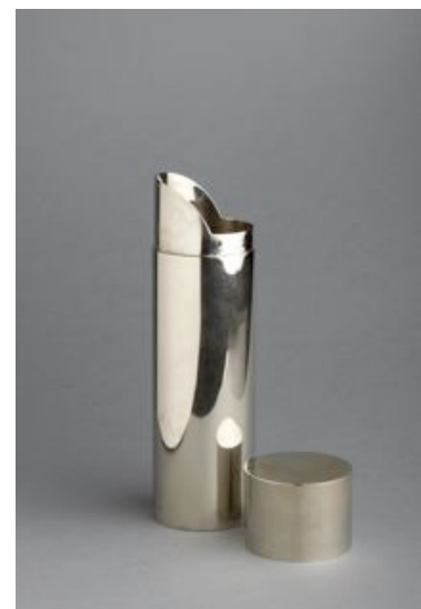
Damon, Centre de table, C. 1930