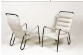
Jean Burkhalter, 3 fauteuils en tube métallique. C. 1930