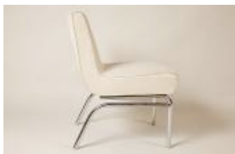
Adrienne Gorska, Paire de chauffeuses, Créées pour l'atelier de Tamara de Lempicka. C. 1935

Ces derniers s'expriment de préférence avec des matériaux simples et nouveaux tels le métal et le verre . Matériaux « architecturés » puis assemblés, prometteurs et surtout duplicables, s'imposent en contrepoint des essences de bois exotique et autre précieux, galuchats chers à l'art déco. Voilà pour la fonctionnalité !