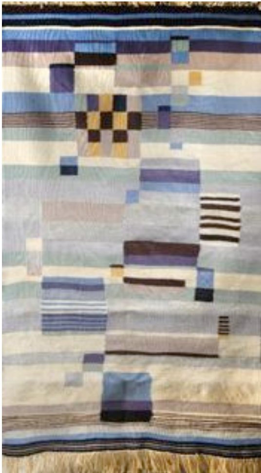
Tapiserie Bauhaus, attribuée à Benita Koch Otte Point noué, Laine beige, marron, bleue, blanche et jaune C.1924/25