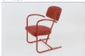
Fauteuil à inclinaison variable, métal tubulaire peint en rouge. C. 1935