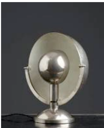
Marcel Louis Baugniet, Lampe, C. 1930