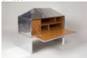
Sarah Lipska, Coffre en aluminium et merisier C. 1925