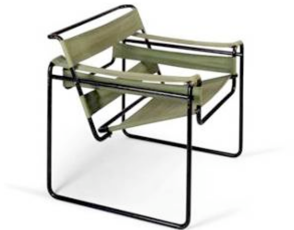
Marcel Breuer, fauteuil B3 'Wassily', 1927/28