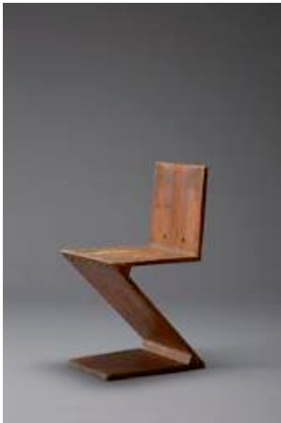
Gerrit Rietveld, Chaise Zig Zag, C. 1934