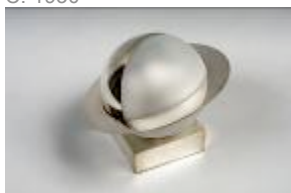
Lampe Métal argenté, verre dépoli. C. 1930.