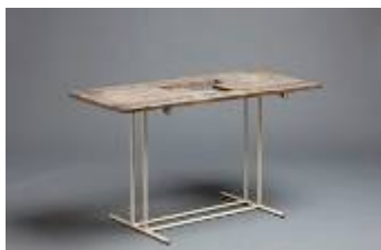
Eileen Gray, Table en pin d'Oregon, Piètement tubulaire en acier peint. C. 1935

Exposition du 13 septembre au 23 octobre 2010