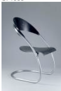
Chaise ST14, provenant de la salle de théâtre de palace de maharaja de Indore the