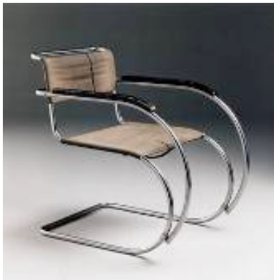
Mies van der Rohe, Fauteuil 'Weissenhof' 1932