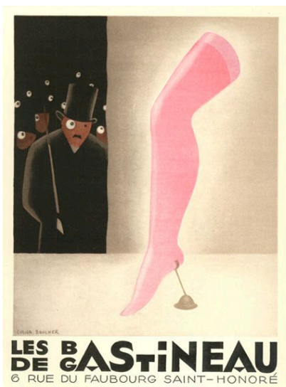
Ci-dessus Lucien Boucher pour PAN, 1928.

Vernissage mercredi 5 septembre 2018 à partir de 18h