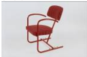
Fauteuil à inclinaison variable, métal tubulaire peint en rouge. C. 1935